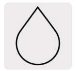
Para cortes en húmedo