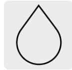
Para cortes en húmedo