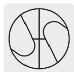
Punta Split Point