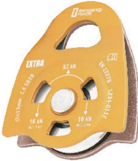
naranja / plata

Polea simple grande para cuerdas textiles.