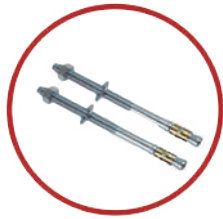
Pernos de anclaje de 1/2 x 7"